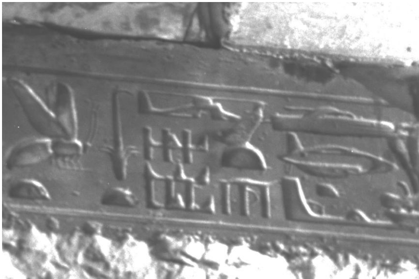
Abb. 1: Der Friesausschnitt aus dem Abydos-Tempel mit der „Darstellung eines Hubschraubers“

Thomas Eickhoff brachte von einer Ägypten-Reise Fotos und die Video-Aufzeichnung eines Türfrieses im Totentempel Sethos' I. in Abydos, mit. Die Bilder zeigten eine Reihe von merkwürdigen Hieroglyphen, die auf einem Türfries über einem Durchgang zu sehen sind (Abb. 2). Ein Teil davon besaß augenscheinlich technische Merkmale. Man konnte darin ohne viel Fantasie einen Hubschrauber, ein U-Boot oder einen Panzer, einen Fluggleiter und Waffen erkennen (Abb. 1).